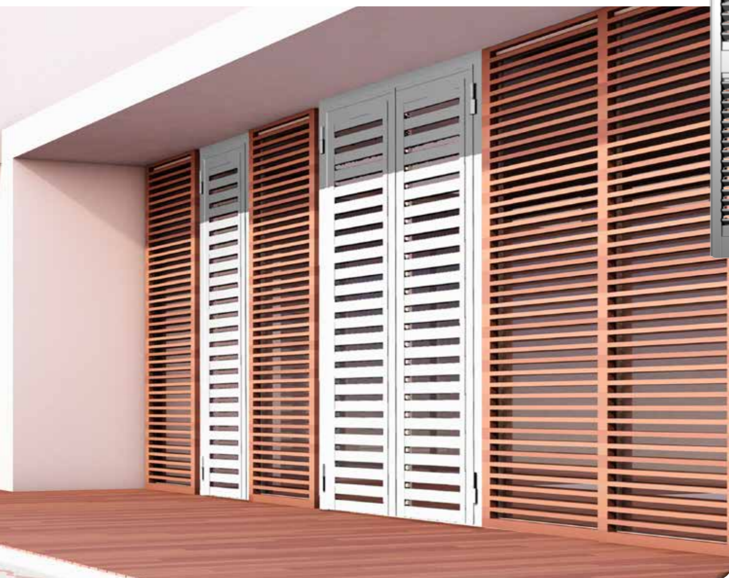
modello Plus 180

Metal Design significa scegliere un prodotto altamente resistente ai tentativi di effrazione. Il design moderno e attuale ed una grande varietà di modelli e colorazioni rendono la gamma personalizzabile e rispondente a qualsiasi tipo di esigenza. Grate e persiane Metal Design si attestano sempre di più come standard di