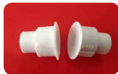
sensori per antifurto

riferimento nel settore. Certificati in classe RC3 i prodotti garantiscono estrema resistenza e ostacolo invalicabile contro i tentativi di furto. Profili in acciaio zincato, serratura a tre punti di chiusura, cilindro europeo, rostri antistrappo alloggiati nel telaio sono alcune delle caratteristiche che identificano i nostri prodotti e li rendono efficaci contro i tentativi di intrusione.